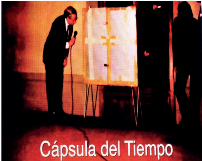
Cápsula del Tiempo